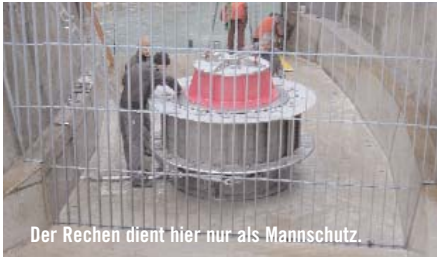
Der Rechen dient hier nur als Mannschutz.